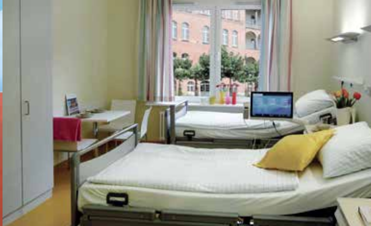
Patientenzimmer Charité Campus-Klinik