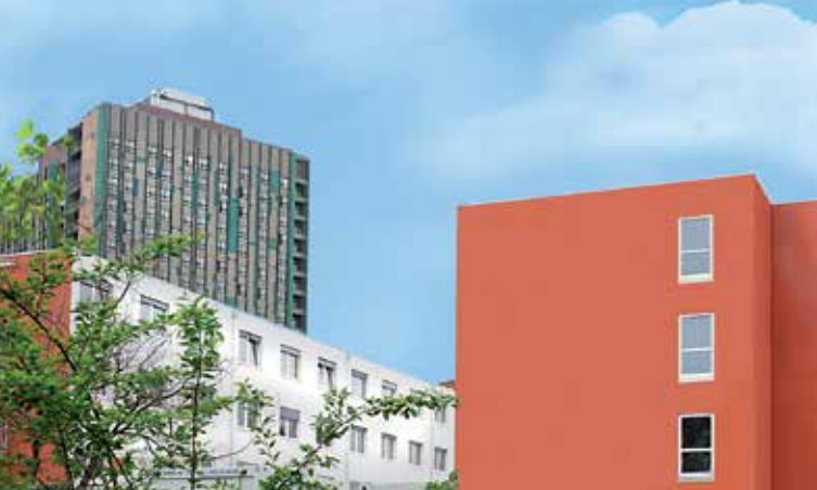
Charité Campus-Klinik, Ansicht Nord